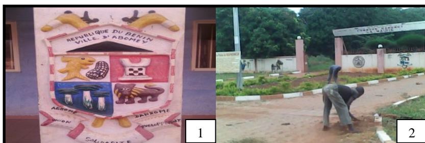
Planche 2. Logo de la mairie d'Abomey et sa devanture avec une enseigne branlante et des broussailles

La seconde image de la planche qui suit en donnera la justification.