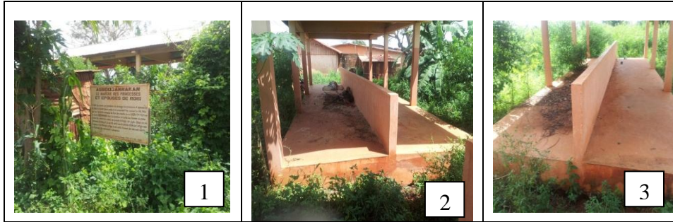
Planche 1. Vue du marché Agbodjannagan réhabilité sans l’avis de la royauté

Prise de vue : Données du terrain, Agbandji, octobre 2012